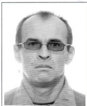
место для фотографии

Согласие на обработку моих персональных данных действует с даты его подписания, до окончания срока действия выдаваемой (заменяемой) тахографической карты. Я уведомлен(а) о своем праве отозвать настоящее согласие в любое время. Отзыв производится по моему письменному заявлению в порядке, определенном законодательством Российской Федерации.